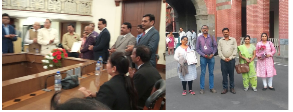
धर्मादाय रुग्णालय गरीब रुग्णांच्या दारी या कार्यक्रमात रुग्ण तपासणीमध्ये पुणे जिल्ह्यातून भारती हॉस्पिटलला तिसरा क्रमांक मिळाला.