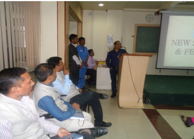
पी.एफ. संदर्भात जाईट कमिशनर यांनी कर्मचाऱ्यांना मार्गदर्शन केले.