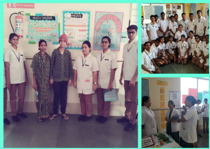
नर्सिंग कॉलेजच्या विद्यार्थ्यांनी आरोग्य मार्गदर्शनपर प्रदर्शनाचे आयोजन केले होते.